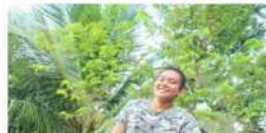
たくさんのことを教えてくれる青年リーダー