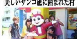
有名なハンバーガー店ジョリビー