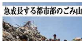
急成長する都市部のごみ山