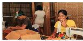
フェアトレード生産者訪問