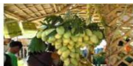
ギマラス島はマンゴー名産地