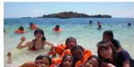
美しいサンゴ礁に囲まれた村